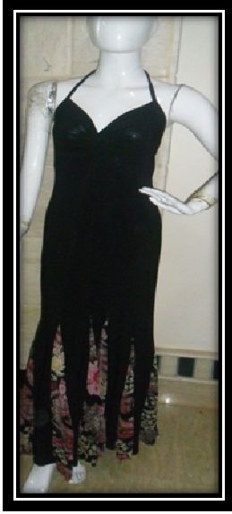
الموديل بدون المكمل