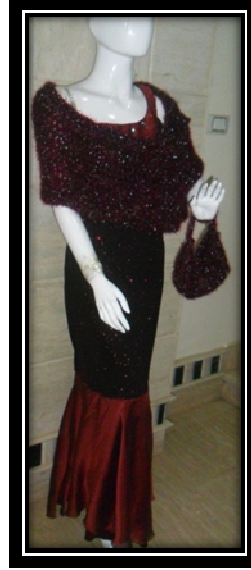
الموديل بعد إضافة المكمل