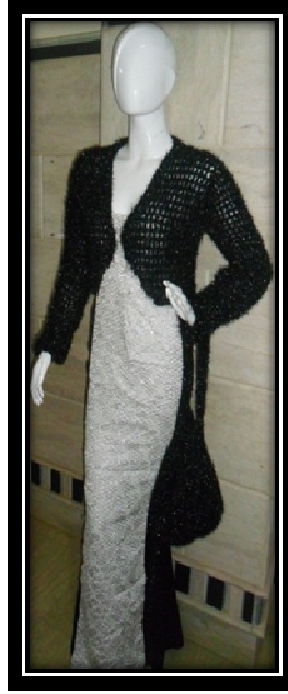
الموديل بعد إضافة المكمل