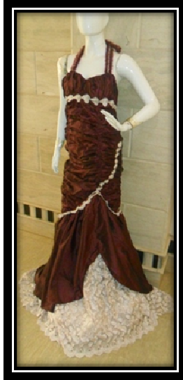
الموديل بدون مكمل