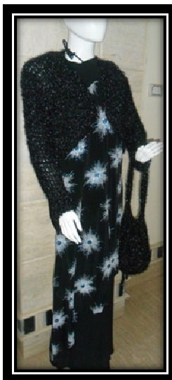
الموديل بعد إضافة المكمل