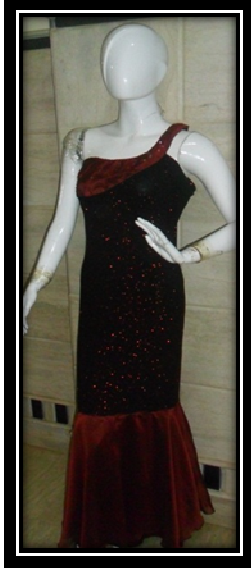
الموديل بدون المكمل