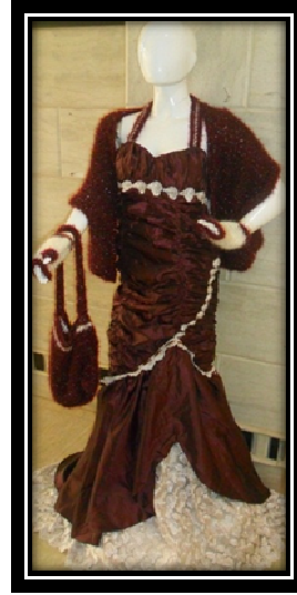
الموديل بعد إضافة المكمل