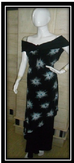
الموديل بدون المكمل