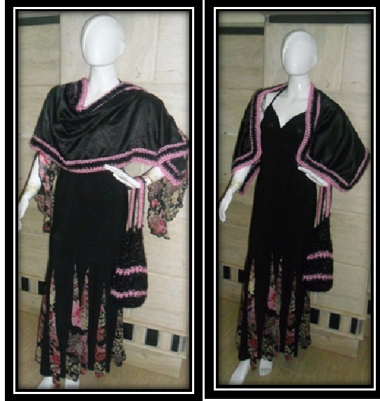
الموديل بعد إضافة المكمل