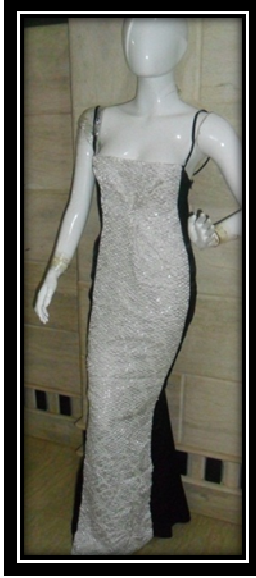
الموديل بدون المكمل