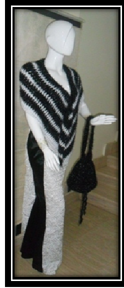
الموديل بعد إضافة المكمل