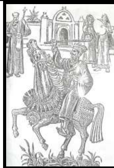
رمز الفارس والحصان