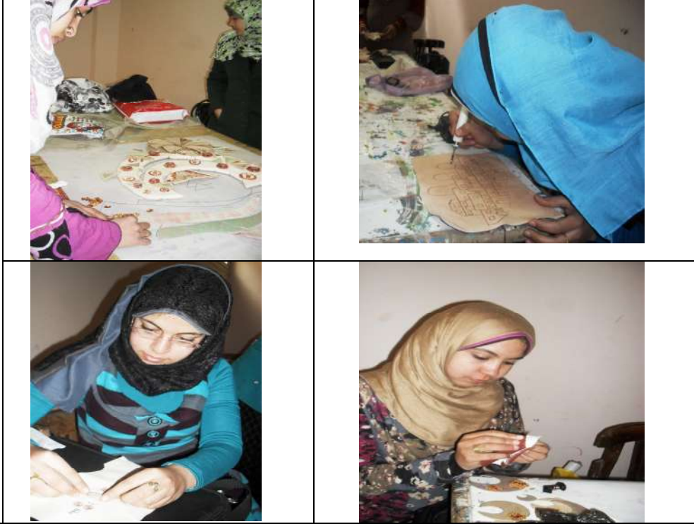
شكل (١١) يوضح الطالبات أثناء أداء التجارب العملية