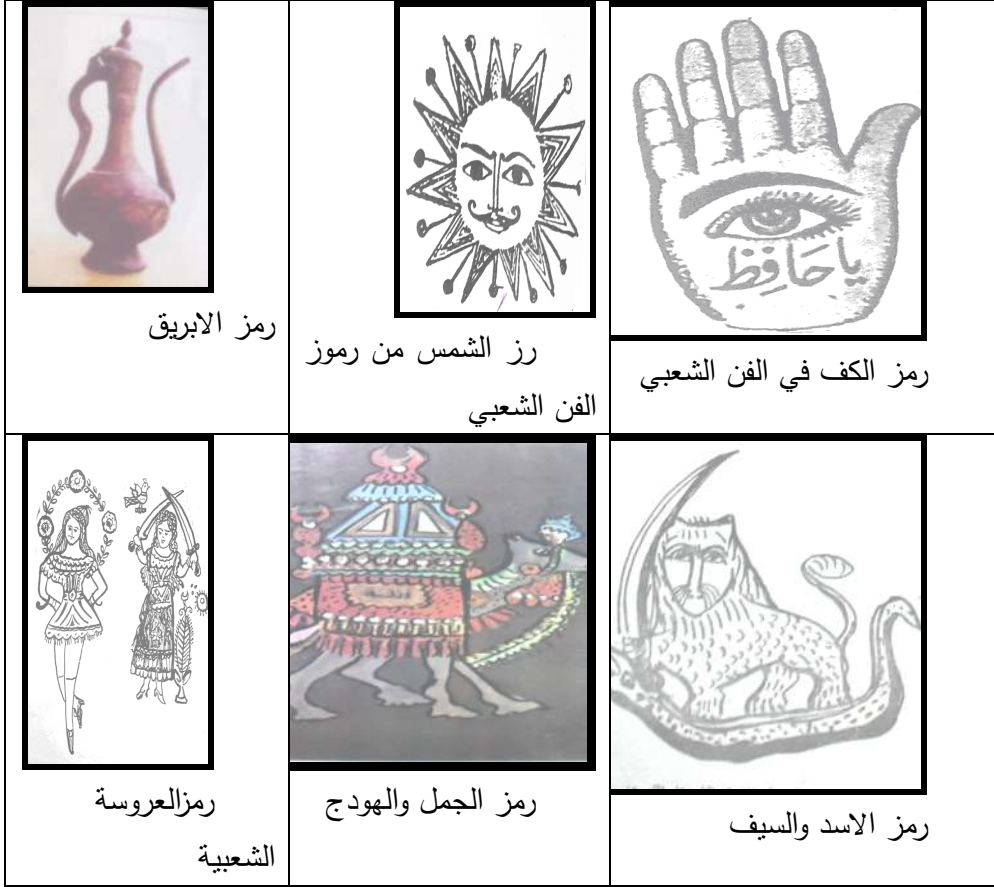
شكل (١) بعض من رموز الفن الشعبي (١٥)