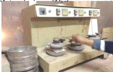
شكل (٣) جهاز قياس مقاومة البلاط للاحتكاك والبرى.

جهاز قياس مقاومة البلاط للاحتكاك والبرى كما هو موضح فى شكل (٣)