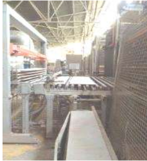
شكل (٥) فرن الحرق لبلاط السيراميك بعد الطباعة