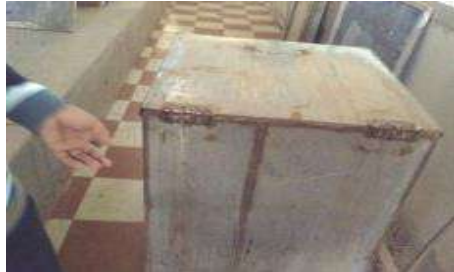
شكل (٤) جهاز قياس مقاومة بلاط السيراميك لامتصاص الماء

جهاز قياس مقاومة بلاط السيراميك لامتصاص الماء كما هو موضح فى شكل (٤)