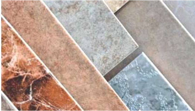
شكل (١) نماذج من السيراميك المصرى. Bottom of Form.

ويوضح شكل (١) نماذج من السيراميك المصرى. ( www.dostor.org/print , 2017 )