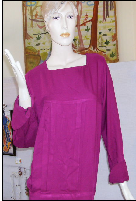
صورة "البلوزة" التي قامت الطالبات بتنفيذها