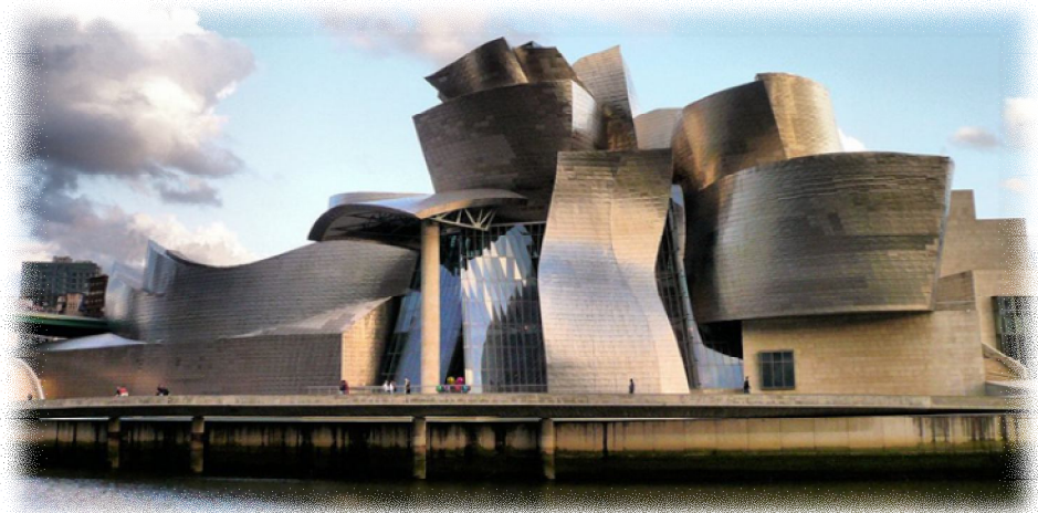
شكل رقم (٢)

"عندما تذكر كلمه التفكيكية فالمبنى الأول الذي تبادر الى ذهنك هو متحف متحف غوغنهايم في بلباو إسبانيا، في عام ١٩٧٨ بدأ جيرري يخطو الخطوات التي من شأنها أن تجلبه إلى هذه النقطة، وبتغيير جذري قياسي ضد الملل بعض الشيء في منازل ضواحي سانتا مونيكا والذي كان أساس للحركة المعمارية بأكمله ، ففكك حرفيا المنزل باقتلاع أقسام واعداد ترتيبها إلى انصهار غريب الأطوار من الجماليات التقليدية والحديثة، بمرور الوقت توصل الى متحف غوغنهايم الذي أنجز في عام ١٩٩٧ م ، فكان لجيرري الكمال، وهو نمط جديد مثير للصدمة أبهر النقاد والجمهور على حد سواء، على الرغم من أن الكثيرين في المجتمع المعماري قد نختلف على هذه النقاط كما الإبداع مقابل وظيفة" (٢٤-١) شكل (٢) .