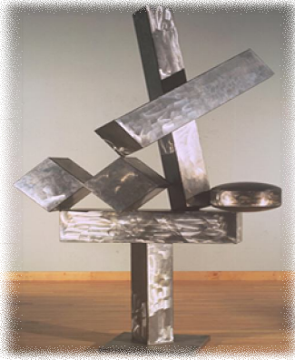
شكل رقم ( ١٩ )

وفي النحت نجد رولان ديفد سميث والذي " إشتهر بمجموعته الفنية (التكعيب) والتي