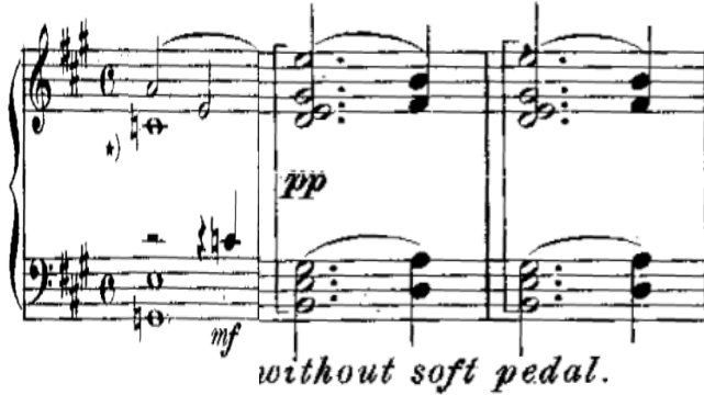
شكل رقم (٥) يوضح م٥، ١٥، ١٦ مسافات هارمونية في اليدين