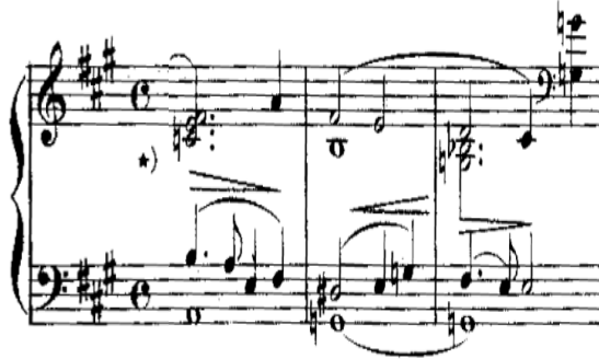
شكل رقم (٨) يوضح ٦م، ٧م، ٨م لأداء اللحن مع نغمة مستمرة