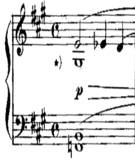
شكل رقم (٤) يوضح م٣ لأداء مسافة هارمونية في اليد اليسرى بإيقاع الروند