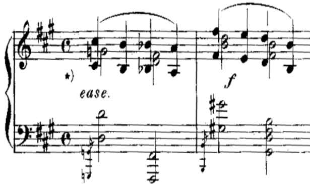
شكل رقم (٦) يوضح ١٣م ، ١٤م

الصعوبة الرابعة: أداء مسافة الأوكتاف الهارمونية في اليد اليمنى واليد اليسرى في معظم أجزاء المقطوعة قد تتسبب في شد عضلي أثناء الأداء العزفي، كما في الشكل التالي وأدائها في شكل قفزات في اليد اليسرى: