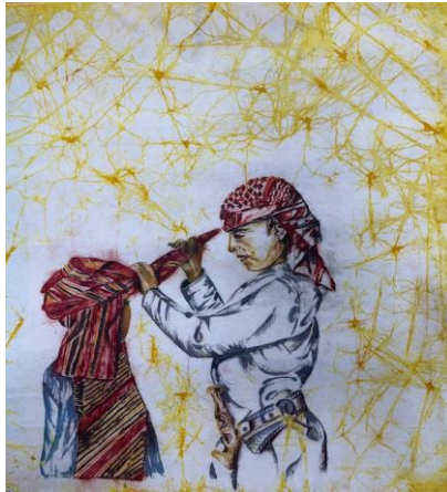
شكل (٢٠) عمل منفذ بتقنية الباتيك طفلان بالزي العماني والخنجر العماني