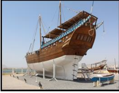
شكل (٨) السفن العمانية