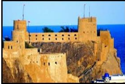
شكل (١٠) القلاع العمانية

اشتهرت عمان بالقلع والحصون ويتردد صدى تاريخ عُمان في آجر الطين والنقوش المجدسة وحجارة معمارها الدفاعي، فهناك ما يربو على الألف من القلاع والحصون وأبراج المراقبة التي تظل شامخة تحرس سهول ووديان وجبال السلطنة، وكل منها يشهد ماضيا يدعو للفخر، ولكل منها قصته الخاصة التي يرويها ومن أهم هذه القلاع الميراني والجلالي وقلعه نزوى وبهلاء وقلعه الرستاق حيث كان العمانيون يعتبرون هذه القلاع رمزا لهم ولقوتهم ويحتمون منها عن الاعداء