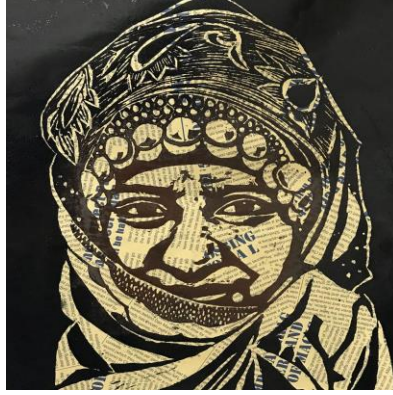
شكل (٢٤) يظهر في هذا العمل البورتريه العماني بالزبي التقليدي مع اكسسوارات الشعر من الفصيات التقليدية مستخدم الحفر على اللينو