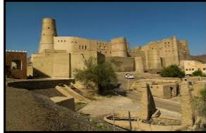
شكل (٩) القلاع العمانية