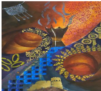
شكل ( ١٧ ) الطالب استلهم رموز الهوية العمانية وهو المبخره العمانية مع لمفردات الزخرفية المستوحاة من الفضيات العمانية مثل القلادة والاسوار الفضية مع رمز القلعة العمانية بتقنية الاستنسل