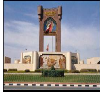
شكل (١١) برج الصحوة