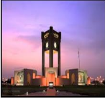
شكل (١٢) برج الصحوة