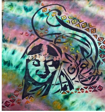
شكل (٢٢) عمل منفذ بدمج تقنيتي العقد والصبغ والاستنسل واستلهم الطالب تصميمه من الزخارف الموجودة في النسيج العماني التقليدي من خلال التكرار المتداخل