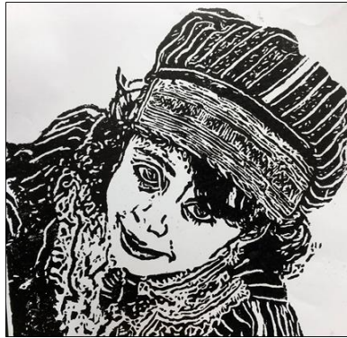
شكل (٢٣) يظهر في هذا العمل الطفلة العمانية بالزي التقليدي لمحافظة الشرقية مستخدم الحفر على اللينو