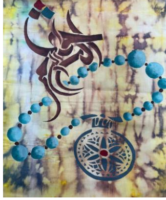
شكل (٢١) عمل منفذ بتقنيتي العقد والصبغ والاستنسل واستفاد الطالب من التصميم الموجود بالقلادة الفضية لينتج العمل الفني بصورة جمالية مبتكرة