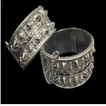
شكل (٤) البنجري المشوك