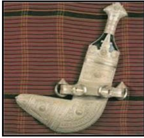
شكل (٢) الخنجر العماني

تعد الخناجر العمانية أحد الموروثات التراثية العديدة التي يتمتع بها الشعب العماني، وقد أصبح سمة بارزة وجزءاً أساسياً في الزي الوطني العماني في كل موقع ومناسبة فهذه الخناجر العمانية تشير إلى مقدرة العمانيين على توظيف معطيات البيئة ويمكن تحويلها إلى أشياء تتسجم مع طبيعة الشخصية العمانية في اعتزازها بتاريخها وحفاظها على أصالة السلوك العربي شكل (١،٢)