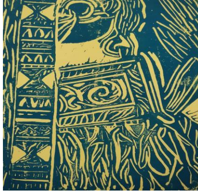
شكل (٢٥) يظهر في هذا العمل زخارف القلادة العمانية التقليدية مع الزخارف التي تتميز بها الأبواب العمانية بتقنية الحفر على اللينو