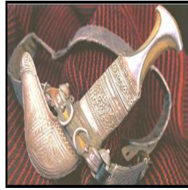
شكل (١) الخنجر العماني