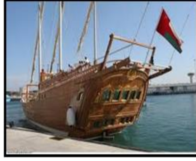
شكل (٧) السفن العمانية