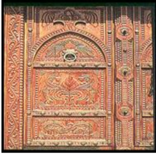
شكل (٦) الأبواب الخشبية

تعتبر الأبواب الخشبية المحفورة الرائعة من مميزات التراث العماني وهو موروث عماني في عمان تعزز هذه الأبواب الخشبية المحفورة المنازل العمانية سواء كان منزل صغير أو منزل عصري. ويمتد تقليد نقش الأبواب الخشبية في دول الخليج العربي ويمكن إيجاد هذه النوعية من الأبواب في ساحل شرق أفريقيا. أوضح رتشارد واخرون (٢٠٠٣) أن مداخل الحصون ولاقلاع والبيوت المحصنة والمباني السكنية مبنية على شكل أبواب بمصراعين، كل منهما مصنوع من ألواح خشبية سميكة، وتعلوها أفاريز أفقية وأنف الباب البارز مفرز لتلقي حافة المصراع الآخر كما هو واضح في شكل (٥-٦).