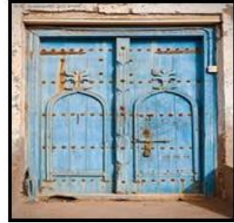
شكل (٥) الأبواب الخشبية