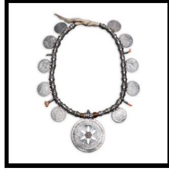
شكل (٣) القلادة العمانية