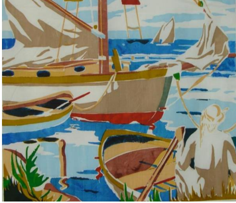
شكل ( ١٨ ) الطالب استلهم فكرته من السفن العمانية ونفذها بتقنية الشاشة الحريرية