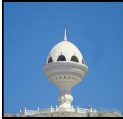
شكل (١٣) مبخرة ريام