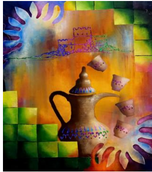
شكل ( ١٦ ) الطالب استلهم رموز الهوية العمانية وهو الدلة العمانية مع خلفية القلاع بتقنية الاستنسل