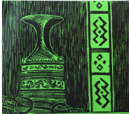
شكل (٢٦) يظهر في هذا العمل الخنجر العماني بتقنية الحفر على اللينو