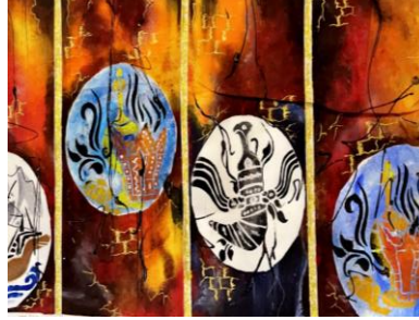
شكل ( ١٥ ) الطالب استلهم رموز الهوية العمانية وهو الخنجر العماني والمبخره العمانية بتقنية الاستنسل

بعض الأعمال الفنية المنتجة من طلاب التربية الفنية في مجال طباعة المنسوجات بمختلف مقرراته مستلهمة رموز الهوية العمانية