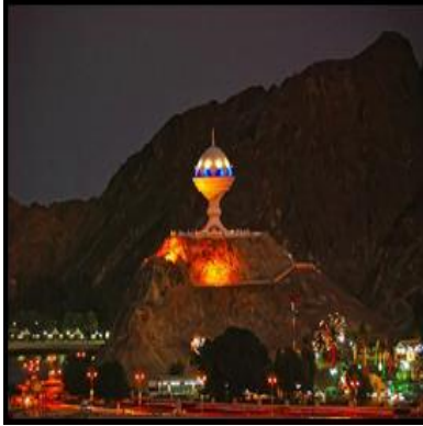
شكل (١٤) مبخرة ريام

تعتبر هذه المبخرة من المعالم الجميلة في مسقط و تقع بولاية مطرح على ارتفاع ٣٠ متراً، ويصل ارتفاع مجسم المبخرة إلى ٢٥ متراً ، كما أنه مرتبط بسوق مطرح ذي الشهرة التاريخية الواسعة، والقادم من سوق مطرح باتجاه مسقط سالك الطريق البحري لا بد أن يرى هذه الصرح الشامخ، وتقع حديقة الريام أسفل منه كما هو واضح في شكل (١٤،١٣).