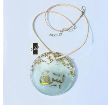
شكل (١٧) تعليقة (علاقة) للسيارة