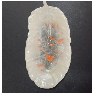
شكل (٢١) علبة للإكسسوارات