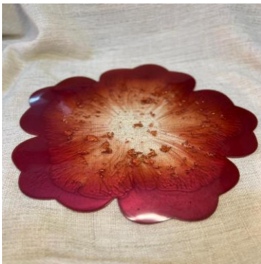
شكل (٢٢) صينية أكواب