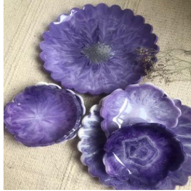
شكل (٧) طقم صواني بأحجام مختلفة