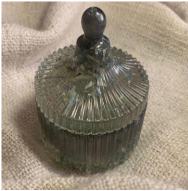
شكل (١٤) علبة للإكسسوارات