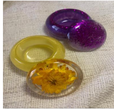
شكل (١٣) علبة خاصة للبخور