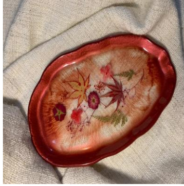
شكل (٥) صينية عطورات من الريزن