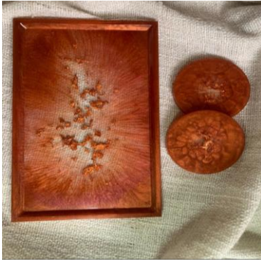
شكل (٨) صينية عطور وبخور