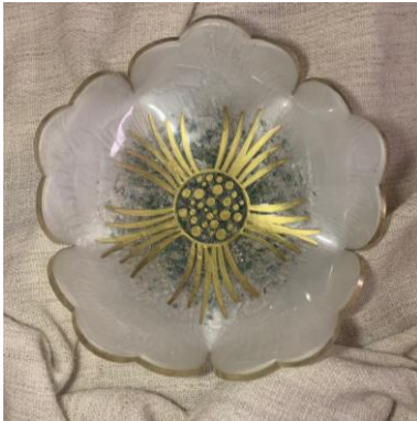
شكل (١٠) علبة مجوهرات