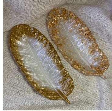
شكل (١١) علب للمجوهرات