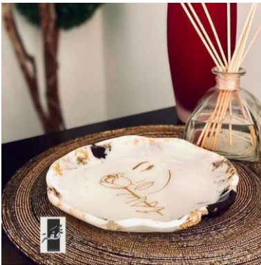
شكل (١٦) طبق للورد المجفف