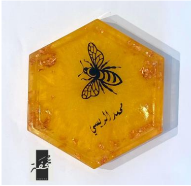
شكل (١٨) ستاند للأسماء