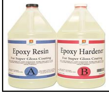
شكل (٢) مادة الريزن صناعة سعودية