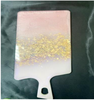
شكل (٢٠) صينية كب كيك