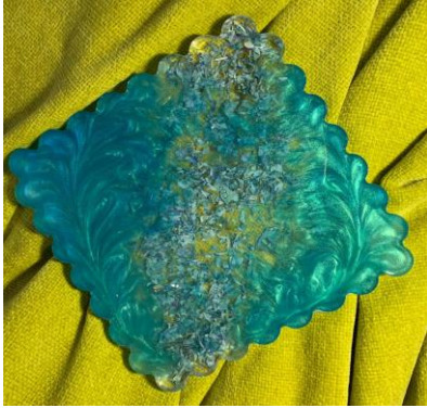
شكل (١٢) قاعدة اكواب