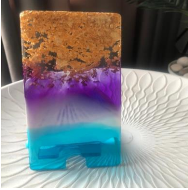
شكل (٦) حامل تلفون

عينة من النتائج العملية لنساء أسر الضمان الاجتماعي من جمعية المرأة العمانية بمسقط والسيب بمحافظة مسقط