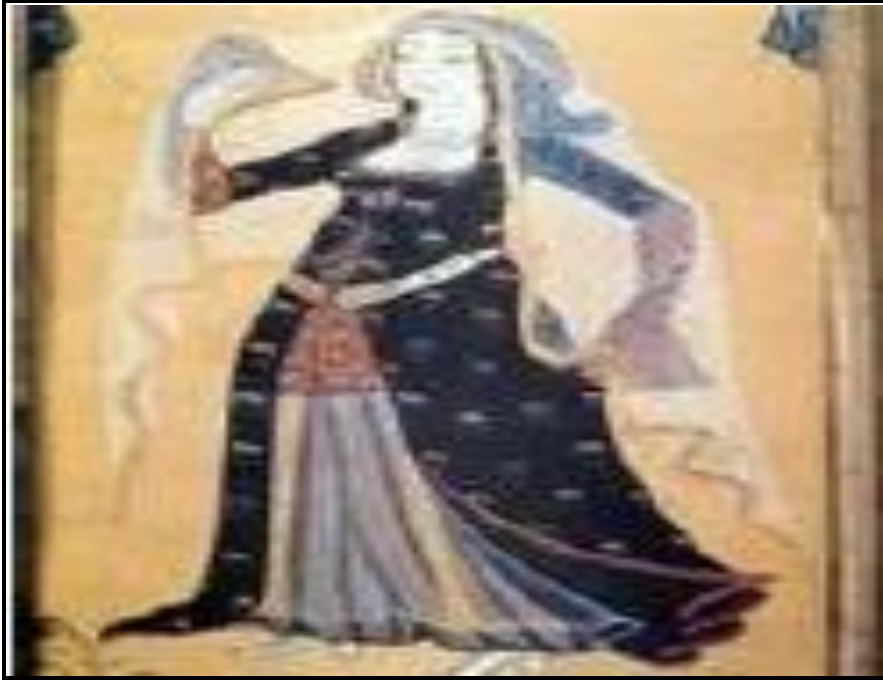
شكل رقم ( ) الشفافية في زي المرأة من العصر العثماني (٢٣)

فقد لجأ الفنان في العصر الإسلامي لاستخدام الشفافية في منسوجاته بل ووظفها في أعماله بانسجام مطلق من خلال التنوع في استخدام الخامات الذي يتبعه تغير في درجة نفاذ الضوء خلالها ومن ثم تنوع درجة الشفافية؛ مما يثري القطعة النسجية بقيم الشفافية " وقد نشطت دور النسيج في العصر الإسلامي في إنتاج أفخر المنسوجات خاصة المنسوجات الحريرية والتي استخدمت الانسجة الشفافة في تزيين بعض أنواع ملابس النساء، وأغطية الرأس المتنوعة، كما استخدم الفنان الإسلامي المنسوجات الشبكية في تزيين الستائر، والمفارش وغيرها(متحف النسيج المصري، ٩٧) " (٢٢) . كما في الشكل رقم ( )