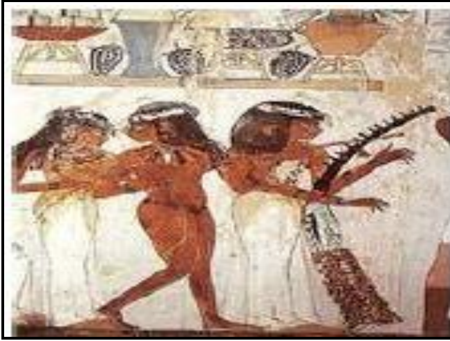
شكل رقم ( ) يوضح الشفافية في ملابس العازفات عند المصري القديم (١٦)

"فقد أبدع الفنان المصري القديم في استخدام الشفافية كما في لوحة العازفات الثلاثة التي أظهرت براعته في استخدام درجات الألوان لإظهار الشفافية في ملابس العازفات كما في الشكل رقم (١٥)". (١٥)