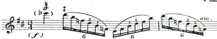
شكل رقم (٢٣) تغيير الأوضاع

يقصد بذلك تحريك الساعد بأكمله واليد اليسرى بما في ذلك جميع الأصابع والابهام، وتلعب مرونة اصبع الابهام دورا أساسيا في تكنيك اليد اليسرى ليبلغ مداها الأقصى الانتقال بين الأوضاع (٢٤)