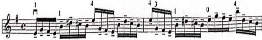
شكل رقم (٤) الديتاشيه البسيط

يؤدي اما بنصف القوس الأسفل أو وسطه أو أعلاه. (٢٠)