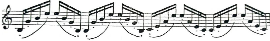
شكل رقم (١) الأريجيو

وبدون اي ضغط من اليد، ويؤدي تغيير الأوتار بواسطة الذراع الأيمن الذي يتحرك بسلاسة وبدون أء، انقطاعاً (٢٣)