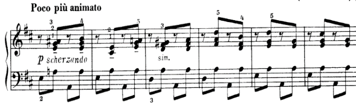
شكل (١٧) م (٥٩: ٦٤) تقنية أداء التضاد بين اليدين

● التقنية الثامنة: م (٥٩: ٦٤) تقنية أداء التضاد بين اليدين.