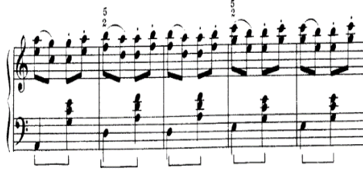
شكل (١٤) م (٣٨: ٤٢) تقنية أداء مسافات هارمونية بنوعها صعوداً وهبوطاً

● التقنية السادسة: م (١٣: ١٧) تقنية أداء المصاحبة بإيقاع ثابت استيناتو.