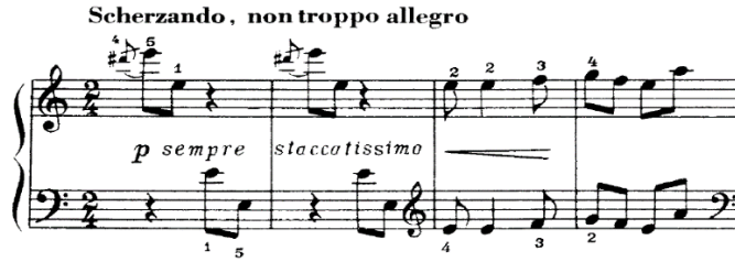
شكل رقم (١) نموذج (م ١ - م ٤)

من م (١) :إلى م (١٠) تنتهي بقفلة نصفية في سلم لا الصغير الطبيعي، بنيت على النموذج التالي: