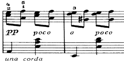
شكل (٦) من م(٢٧:٢٨) جزء من الجملة الثانية

القسم (B) من م(٢٧) : م(٤٨) وينتهي بقفلة نصفية في سلم صول الكبير، بني على النموذج الآتي: