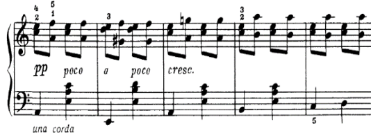
شكل (١٦) م (٢٧: ٣١) تقنية التدرج في السرعة

● التقنية السابعة: م (٢٧: ٣١) تقنية أداء التدرج في السرعة.